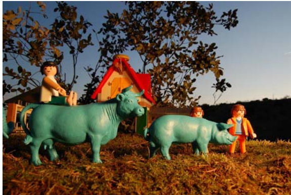
Selección del reportaje fotográfico (Fotografía digital 50x30cm RC s/dibond 7/7+PA)