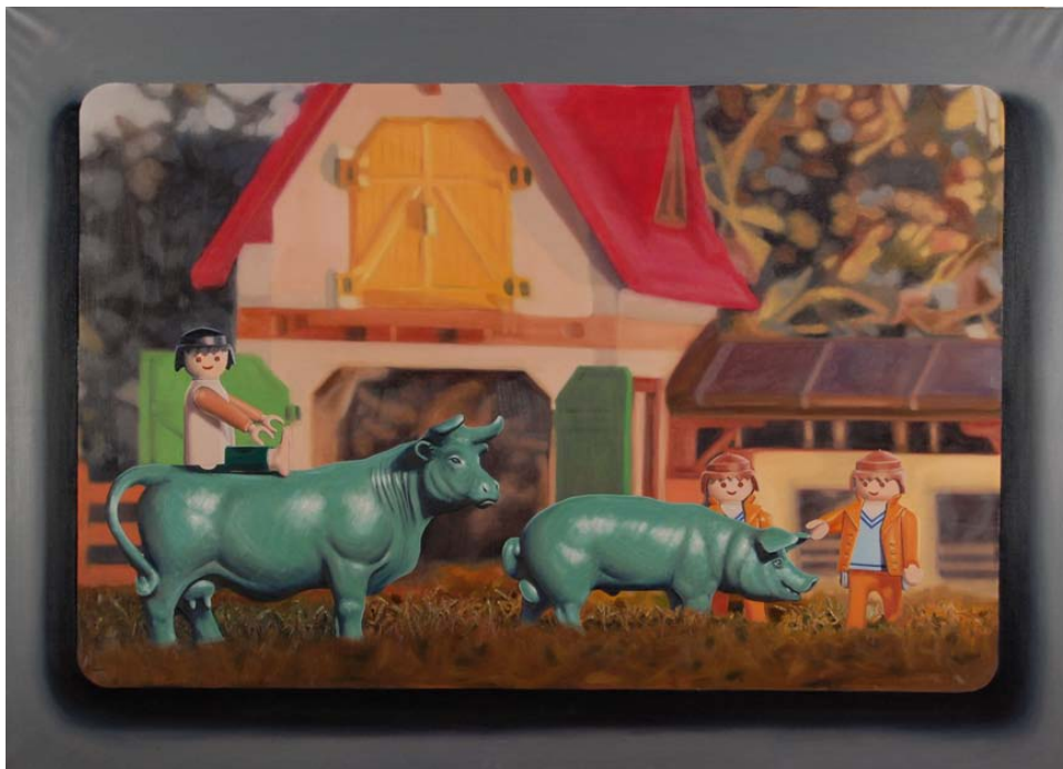
Pintura al óleo s/lienzo 200 x 150cm